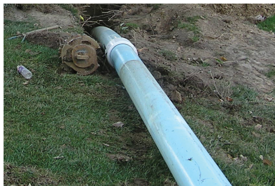
Installation d'une conduite Certa-Lok/RJ par FDH qui démontre la capacité de courbure d'un tronçon de conduite Certa-Lok sans compromettre l'intégrité du joint à garniture.